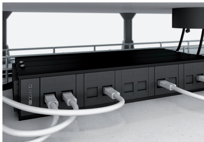
ES. Salida para conexiones RJ45.