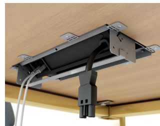
FR. Accès connexions.