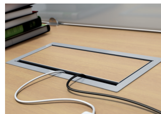
FR. Détail couvercle Box Plus.