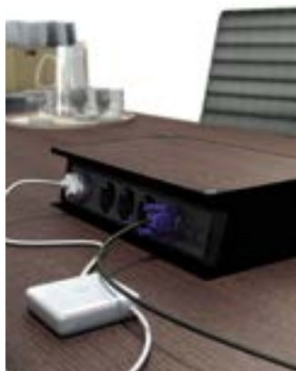
Meeting ouvert. Open Meeting.