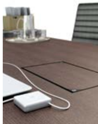
Meeting fermé. Closed Meeting.